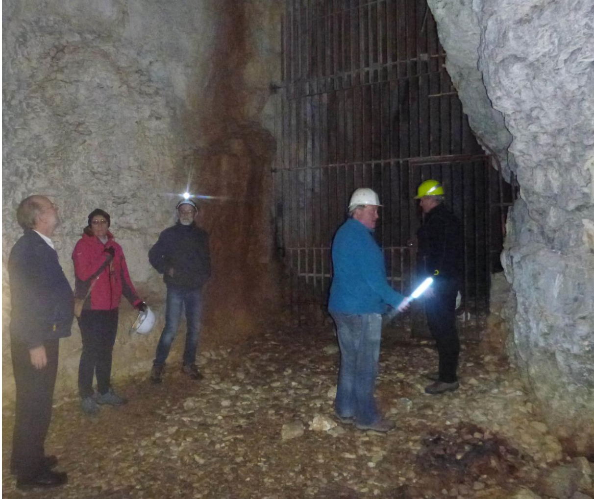
Visite de la grotte du Brudour

Tél : 09 83 08 00 65 - Fax : 09 81 38 24 43 - www.geologues-gif.com